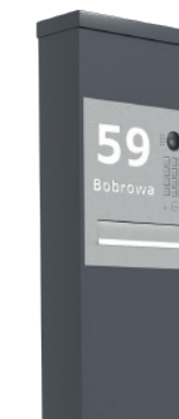
ADRES POSESJI WYPALANY NA PŁYCCIE

*Podświetlenie górne słupka można łączyć z dowolną opcją personalizacji adresu.