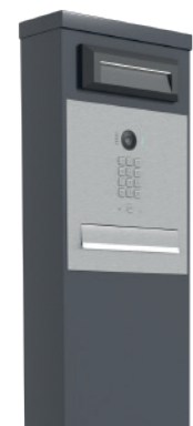
PODŚWIETLENE GÓRNE SŁUPKA