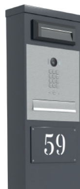
TABLICZKA Z NUMEREM PRZYKRĘCANĄ