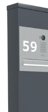
NUMER POSESJI WYPALANY NA PŁYCCIE